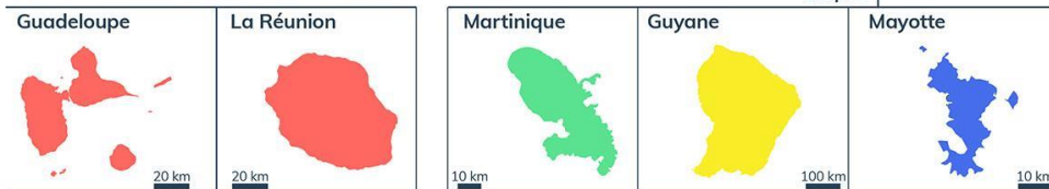
Collectivités d'outre-mer (COM)